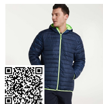
NORWAY SPORT RA5097