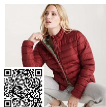
FINLAND WOMAN RA5095